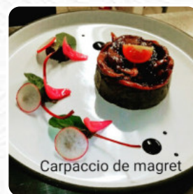
Carpaccio de magret

Ici, tu trouveras la carte de La Table De La Bastide à Cite de Carcassonne . Pour le moment, il y a 30 plats et boissons sur la carte. Dans le cœur de Carcassonne, un restaurant séduisant se distingue par sa cuisine raffinée et son accueil chaleureux. Les plats, souvent magnifiquement présentés, explorent des saveurs variées, même si certains convives ont relevé un manque de caractère dans certains ingrédients. Malgré tout, le rapport qualité-prix est apprécié, offrant un menu bien conçu qui satisfait tant les familles que les amateurs de gastronomie. Le cadre agréable et la qualité du service, conjugués à un cadre charmant, en font un lieu de choix pour une soirée tranquille. Une découverte à recommander sans hésitation, mais avec des améliorations nécessaires sur certaines prestations.